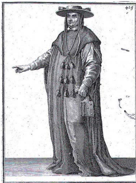
Cardinale nel 1500

Un ensayo acerca de la reforma del Colegio Cardenalicio y del episcopado en el siglo XXI