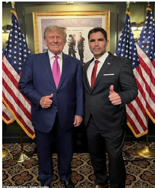
«Has hecho de esta la película más popular del mundo»: Trump felicita a la estrella de Sound of Freedom, Jim Caviezel, durante la proyección de Bedminster después de que los medios liberales intentaran destrozr una película contra la trata de personas por estar influenciada por QAnon | Daily Mail Online