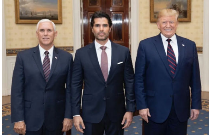
La polémica foto de eduardo verástegui y donald trump | La Opción de Chihuahua (laopcion.com.mx)